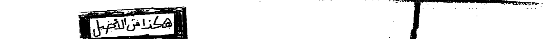
هكذا من التحصيل